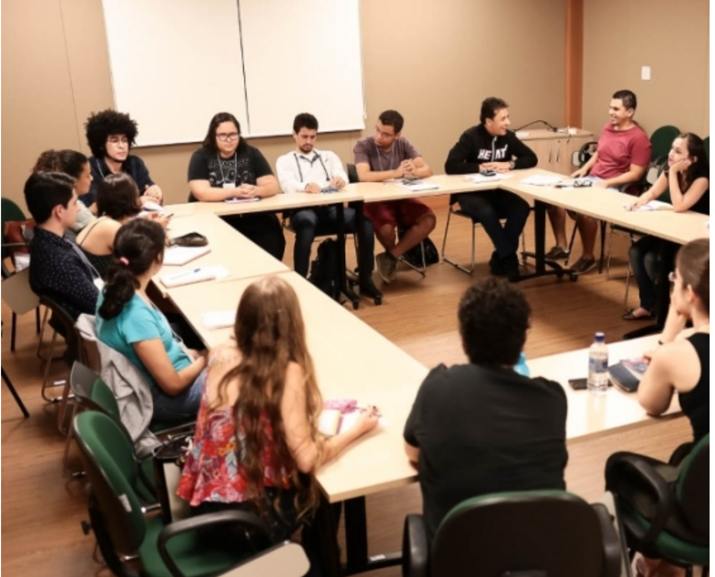
11º Curso

Roteiristas, diretores, estudantes de audiovisual e realizadores goianos podem se inscrever no 12º Curso de Desenvolvimento de Roteiros Audiovisuais, a partir desta terça-feira (17), até 20 de fevereiro, pelo site do Icu ( http://www.icumam.com.br/12_curso_cinema/ ). Para a etapa 1, o Instituto de Cultura e Meio Ambiente disporá módulos: Animação, Documentário, Ficção, Séries de TV (drama) e Série de TV (humor), ministradas durante março, em Goiânia. A divulgação dos selecionados acontece em 24 de fevereiro.