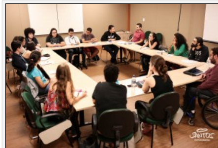
11º Curso

Roteiristas, diretores, estudantes de audiovisual e realizadores goianos podem se inscrever no 12º Curso de Formação Profissional – Núcleo de Desenvolvimento de Roteiros Audiovisuais , a partir desta terça-feira, dia 17, até 20 de fevereiro, pelo site do Icumam . Para a etapa 1, o Instituto de Cultura e Meio Ambiente disponibiliza 100 vagas distribuídas em cinco módulos: Animação , Documentário , Ficção , Séries de TV (drama) e Série de TV (humor), ministradas durante duas semanas, de 15 a 17 e 22 a 24 de março, em Goiânia. O Curso de Formação Profissional tem incentivo da Lei Goyazes , o Programa Estadual de Incentivo à Cultura . A divulgação dos selecionados acontece em 24 de fevereiro.